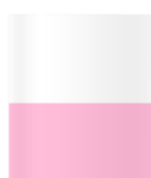
1/2 Page Largeur