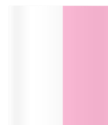
1/2 Page Hauteur