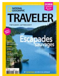
Trimestriel Tirage 45 000 ex.