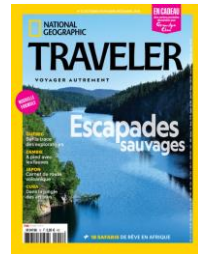
Trimestriel Tirage 45 000 ex.