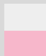
1/2 PAGE LARGEUR