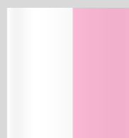
1/2 PAGE HAUTEUR