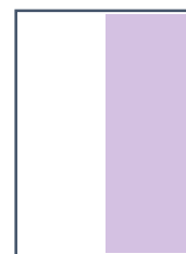
½ page Hauteur